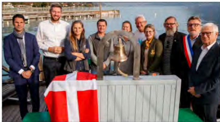
La remise de la cloche Paccard à l'Espérance III, un beau moment d'émotion.